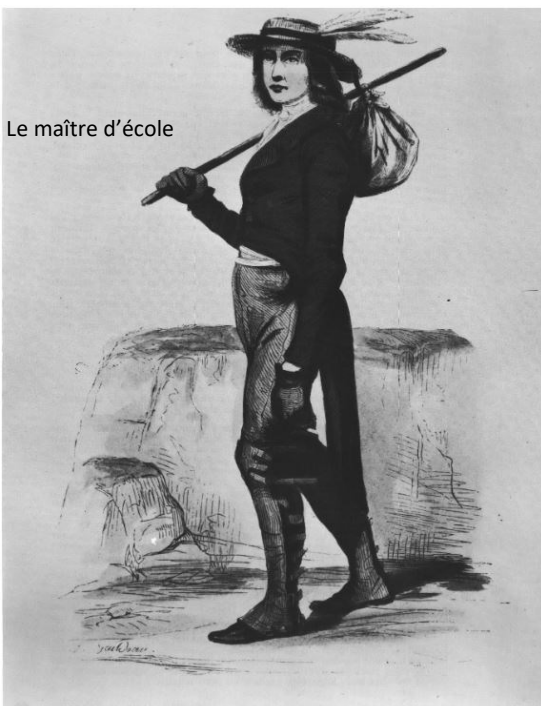
Le maître d'école

« Des archives...confirment la généralisation de l'alphabétisation. Les registres de conscrits dépouillés systématiquement entre les années 1820 et 1870 montrent des Queyrassins possédant à 99 % le degré 1 (lire), à 90 % les deux niveaux 1 et 2 (lire et écrire) et à 80 % les trois niveaux (lire, écrire et compter). » [Granet-Abisset Anne-Marie.